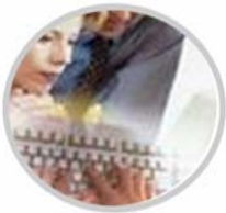
Auswertung der Transportdaten