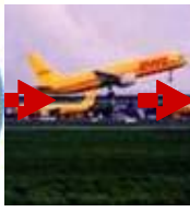
Transport (Strasse, Bahn, Luft)