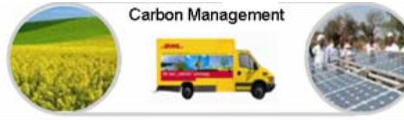
Interne und externe Emissionsminderungs- projekte zum Ausgleich der CO 2 Emissionen.